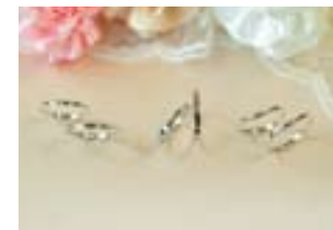
結婚指輪3種／左：Lien(絆) 中央：Avenir(未来) 右：Sourire(笑顔)

実施日程及び会場：2011年7月3日 岩手県(釜石市立鉄の歴史館)／2011年7月10日(茨城県アクアワールド茨城県大洗水族館)／2011年7月24日 宮城県(公立大学法人宮城大学・大和キャンパス)／2011年7月30日 岩手県(マリオス盛岡地域交流センター)／2011年7月31日 栃木県(那須ステンドグラス美術館)