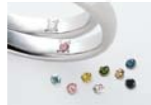
プロミスダイヤモンド